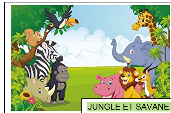
JUNGLE ET SAVANE